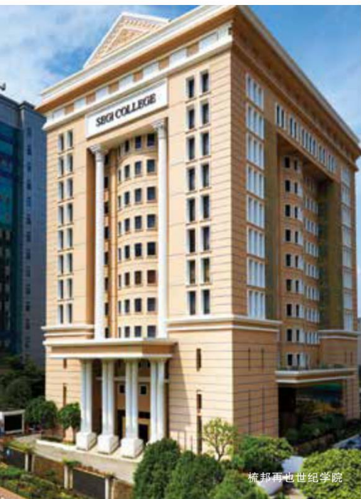
梳邦再也世纪学院