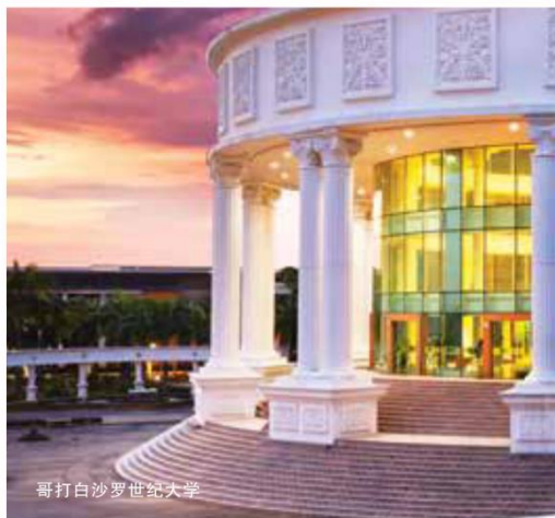
哥打白沙罗世纪大学